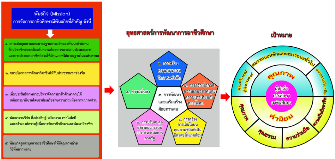
ภาพที่ ๒ ความเชื่อมโยงสาระสำคัญของแผนพัฒนาการอาชีวศึกษา พ.ศ. ๒๕๖๐ - ๒๕๗๙